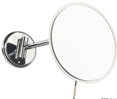
REF 8 66 301 Espejo de 1 brazo UL 1 : 12