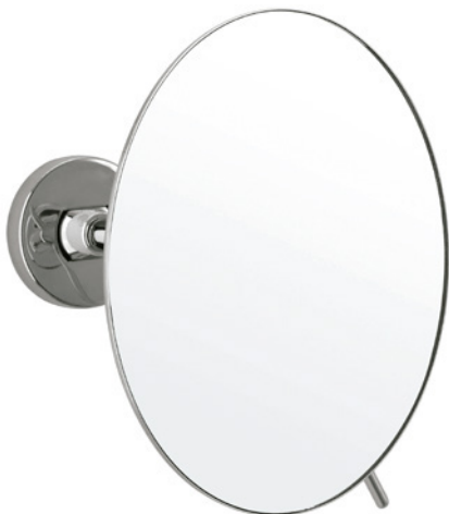
REF 8 66 1410 Espejo de 1 brazo UL 1 : 12